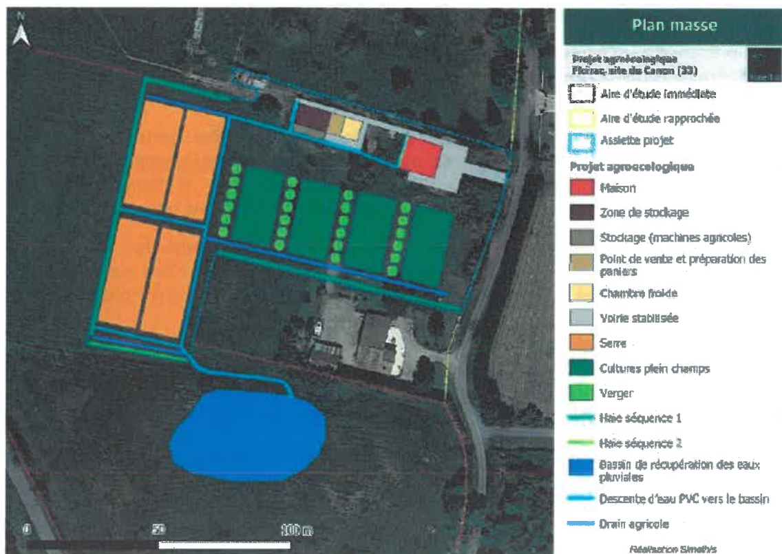
Figure 2 : Plan masse du projet