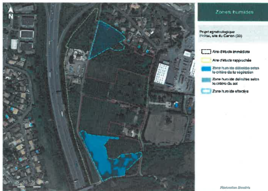
Figure 3 : Localisation des zones humides évitées hors emprise projet

1,9 ha de zones humides ont été identifiées au Sud de l'emprise du projet et au Nord dans l'aire d'étude immédiate. Elles seront intégralement évitées tant en phase chantier qu'en phase exploitation.